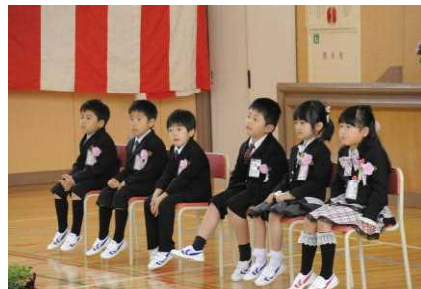
すてきな12名の1年生が入学しました！