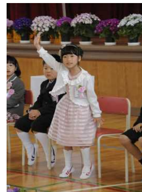
名前を呼ばれて「はい！」