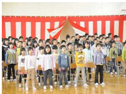
いつ聞いても見事な歌声