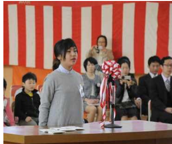
堂々とした児童代表の歓迎の言葉